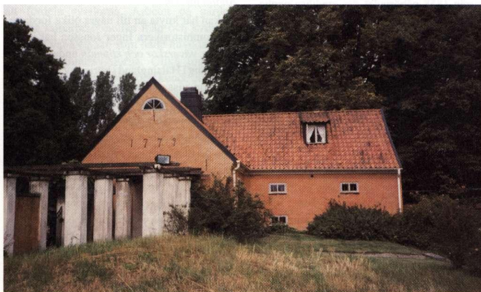
Bild 2. Familjen Winbergs brännvinsbränneri vid herrgården Stensnäs utanför Karlshamn.