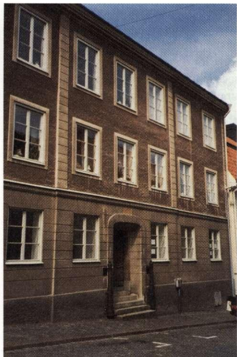
Bild 1. Familjen Winbergs hus på Drottninggatan i Karlshamn.