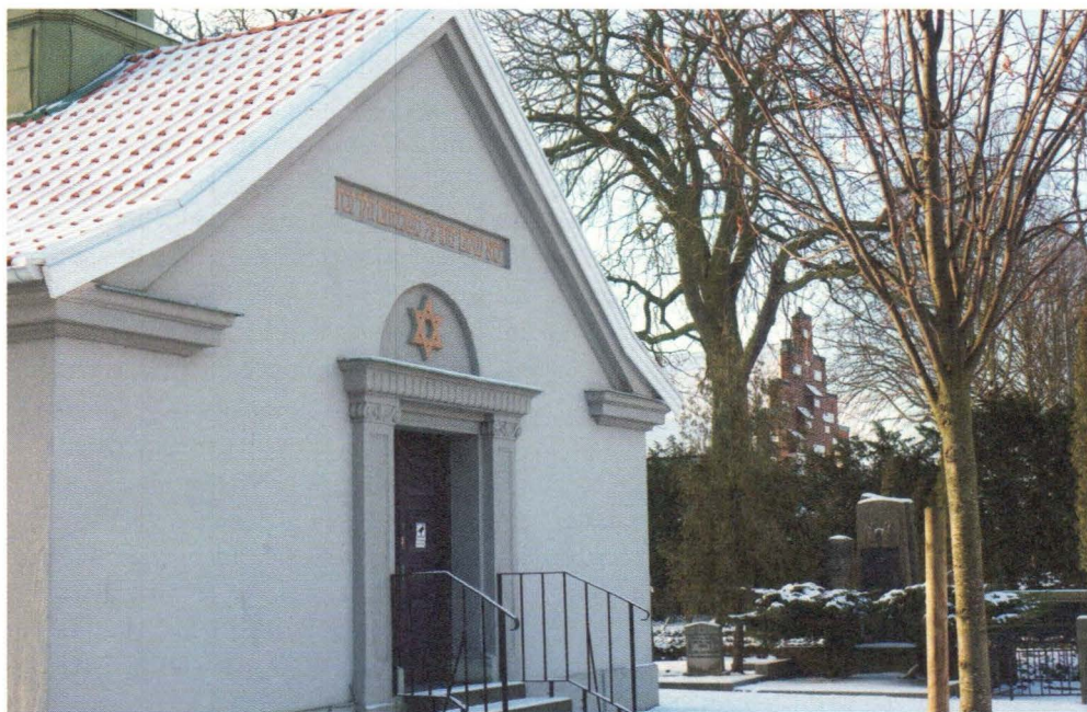
Kapellet på judiska begravningsplatsen.