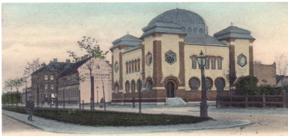
Synagogan på Föreningsgatan i Malmö invigdes 1903.