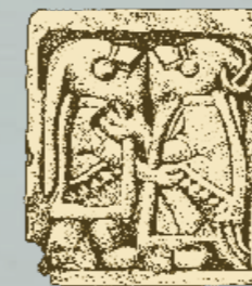
Guldgubbe från Slöinge

16 SLÖINGE Hallands mest kända och fyndrika boplatser från yngre järnålder, ca 400–1050 e. Kr., främst uppmärksammas beroende på den stora mängden fynd av s.k. guldgubbar (små tunna guldblåtar med präglade motiv). Undersökningar visar att platsen utgjort ett regionalt centrum av politisk, ekonomisk och religiös betydelse. Informationsskylt med utsikt över fornlämningsmiljön finns vid Berte kvarn. → Se ALE 1993/2. ☞ L1997:5719